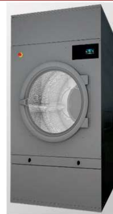
Foto: BÖWE SB-17-TP2 AQUEOUS Trockner