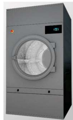
Foto: BÖWE SB-60-TP2 AQUEOUS Trockner

Trommelvolumen: 1500 Liter Beladekapazität: 75 kg Dampfbedarf ca. 150 kg/h elektr. Anschlusswert 3,75 KW Abmessungen LxBxH mm 1270x1598x2380 Gewicht: 660 kg