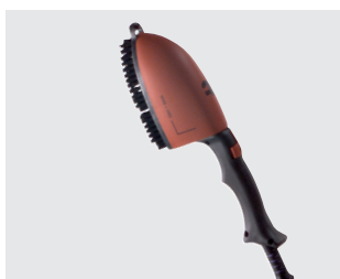
Spazzola vapore riscaldata 500 W Heated steam brush 500 W