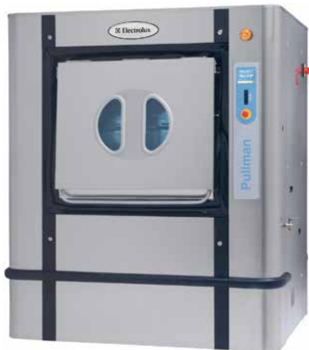
Die Abbildungen sind lediglich typische Beispiele des Produkts. Abweichungen sind möglich.