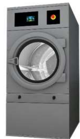
Foto: BÖWE SB-17-TP2 Trockner

Trommelvolumen: 460 Liter Beladekapazität: 23 kg Heizleistung: 24 KW Elektrischer Anschluss: 24,97 Abmessungen LxBxH mm: 890x1255x1812 Gewicht: 210 KG