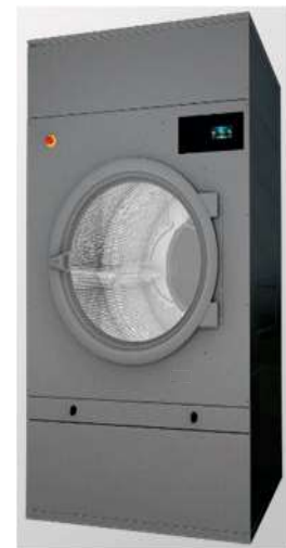
Foto: BÖWE SB-45-TP2 Trockner

Trommelvolumen: 890 Liter Beladekapazität: 45 kg Heizleistung: 54 KW Elektrischer Anschluss: 55,9 KW Abmessungen LxBxH mm: 1270x1106x2380 Gewicht: 395 KG