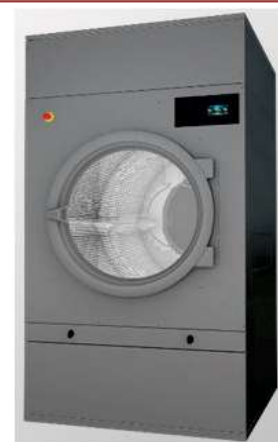
Foto: BÖWE SB-45-TP2 Trockner

Trommelvolumen: 890 Liter Beladekapazität: 45 kg Dampfbedarf ca. 90 kg/h Elektr. Anschlusswert 1,9 KW Abmessungen LxBxH mm 1270x1106x2380 Gewicht: 395 KG