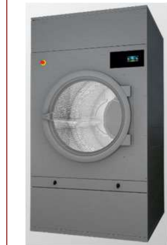
Foto: BÖWE SB-60-TP2 Trockner